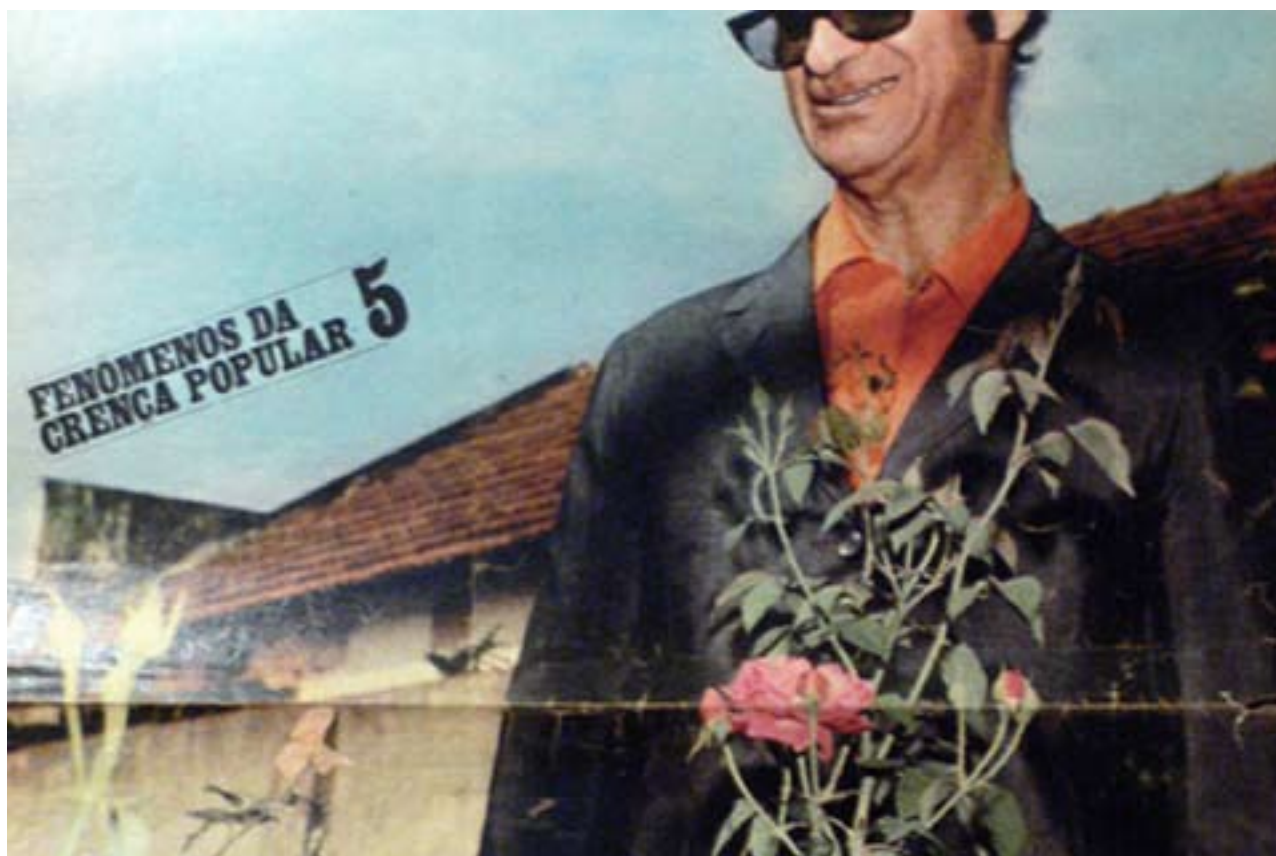
A Man called love, 2007/08 Slide projection with sound Diaprojektion mit Ton still