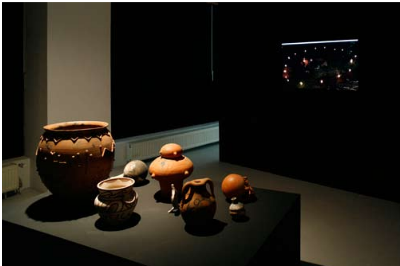
Goddess Worship, 2008 Installation view at magnus müller Ausstellungsansicht bei magnus müller