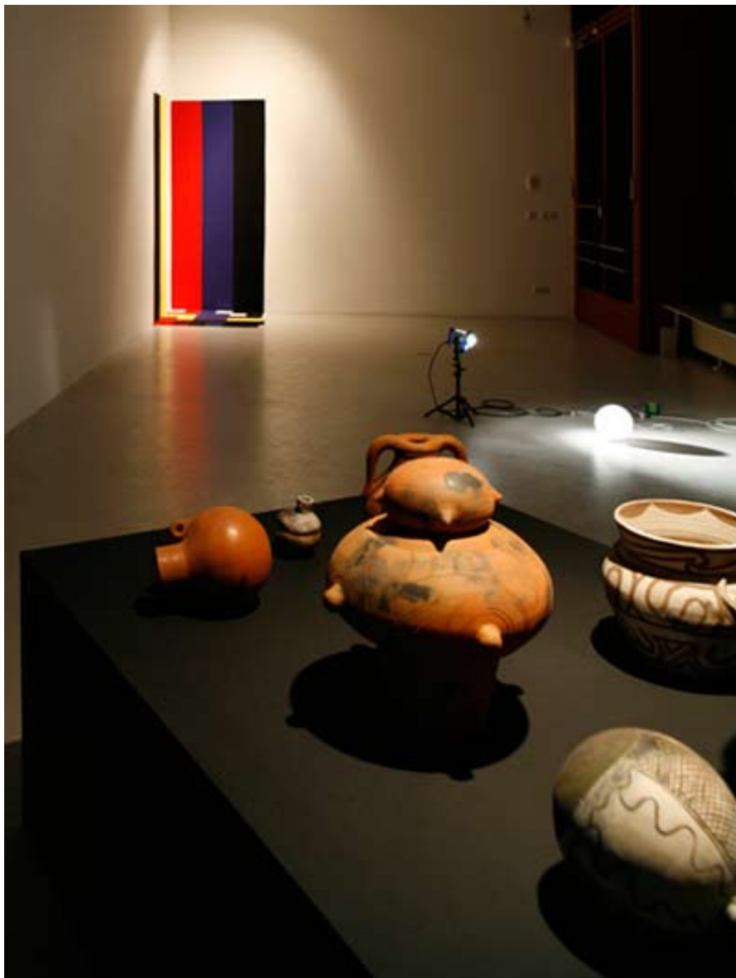
Goddess Worship, 2008 Installation view at magnus müller Ausstellungsansicht bei magnus müller