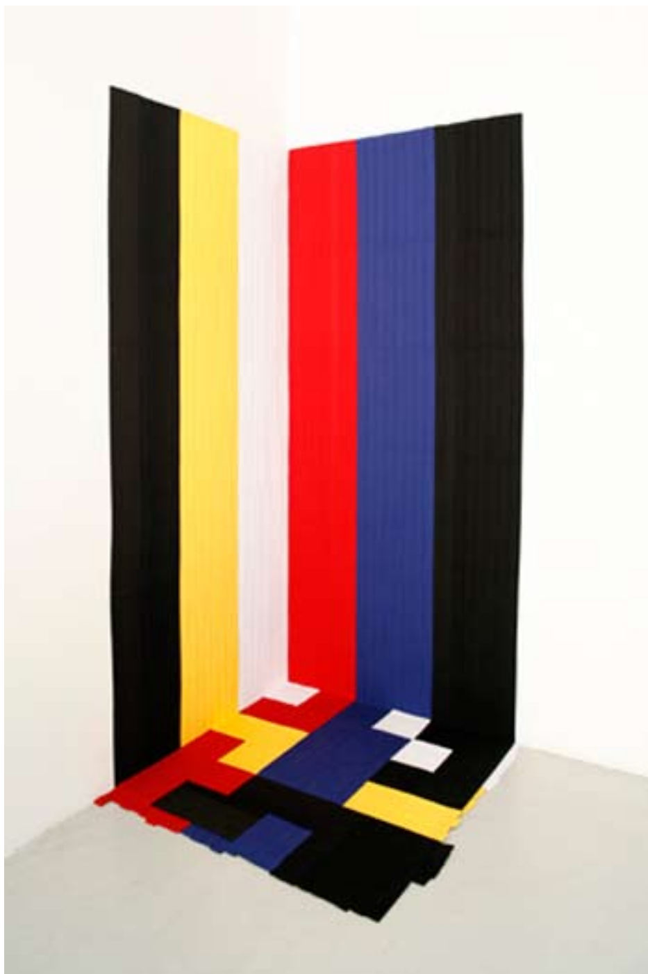
United by chance, 2008 48 martial art belts, variable dimensions 48 Karategürtel, variable Größe installation view at magnus müller / Installationsansicht bei magnus müller