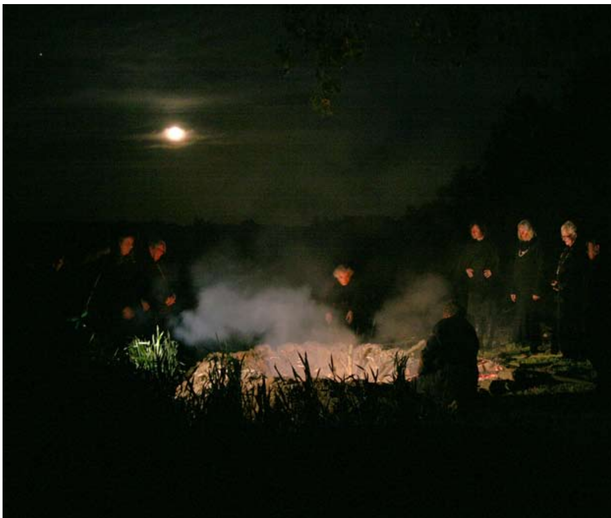
Moon Rituals, 2007 Single screen video (16:9) video still