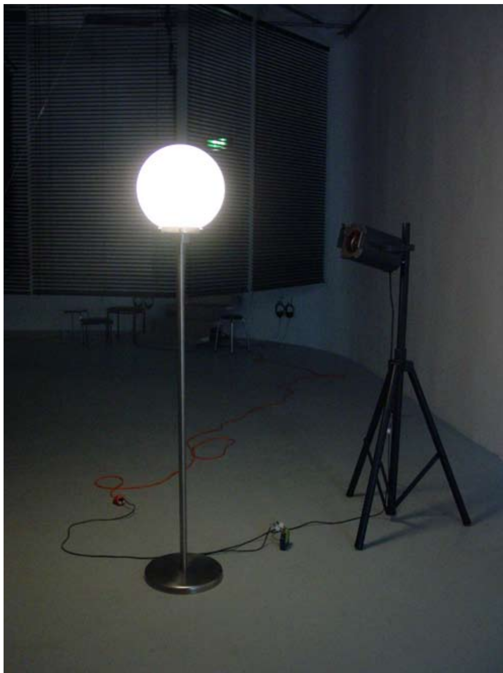
Relational Irrelevance - Version Utrecht, 2006 Two Lamps / Zwei Lampen