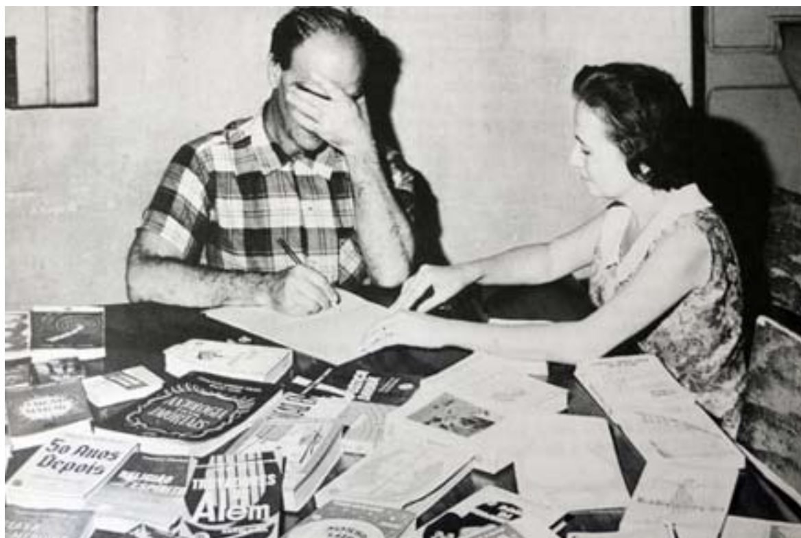
A Man called love, 2007/08 Slide projection with sound Diaprojektion mit Ton still