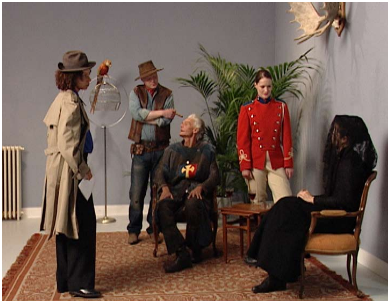
Three screen video installation, 14min, Digital Betacam video, 2005 Dreikanal - Videoinstallation, 14 min, Digital Betacam Video video still