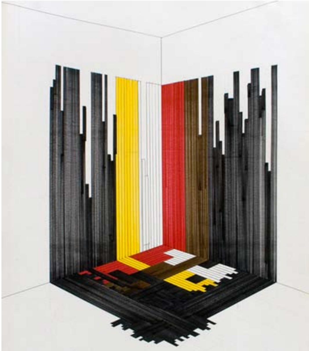
Untitled, 2008 Marker on paper Filzstift auf Papier