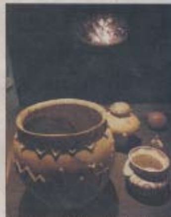
Blick in die Gruppen-Schau bei magnusmüller