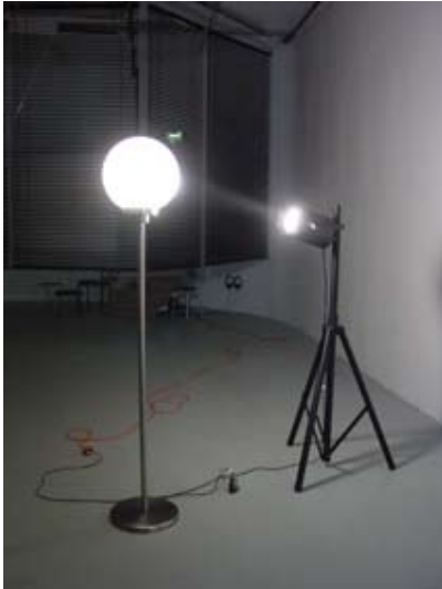
Haegue Yang, Relational Irrelevance - Version Utrecht, 2006

Opening: Saturday, February 16th, 6pm – 9pm exhibition dates: February 16th - March 29th, 2008