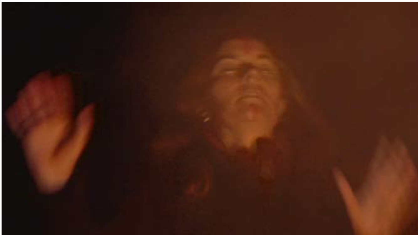
Moon Rituals 2007 Single screen video (16:9) Video stil